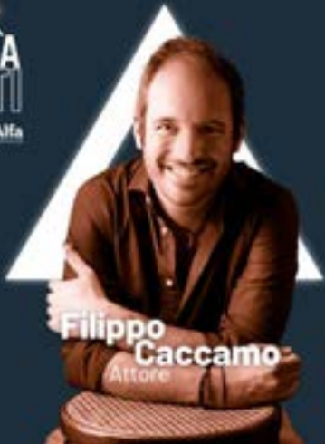
Filippo Caccamo Attore