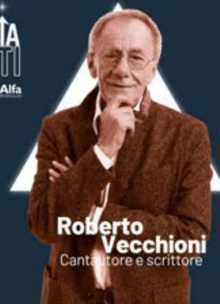
Roberto Vecchioni Cantautore e scrittore