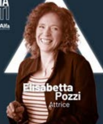
Elisabetta Pozzi Attrice