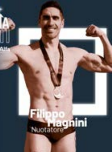
Filippo Magnini Nuotatore