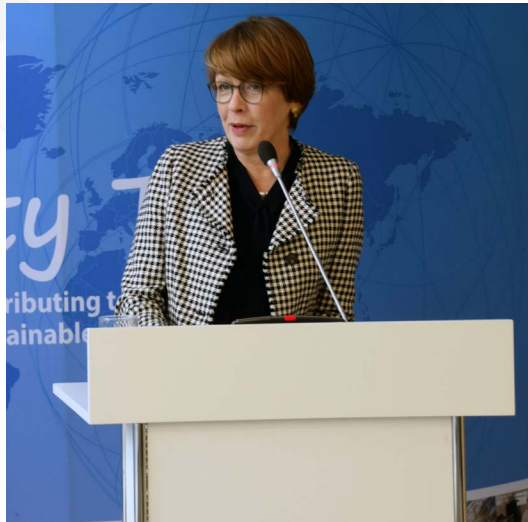
Elke Büdenbender se dirige a los asistentes en la apertura del Foro.

describieron los desafíos y oportunidades que conllevan los cambios;