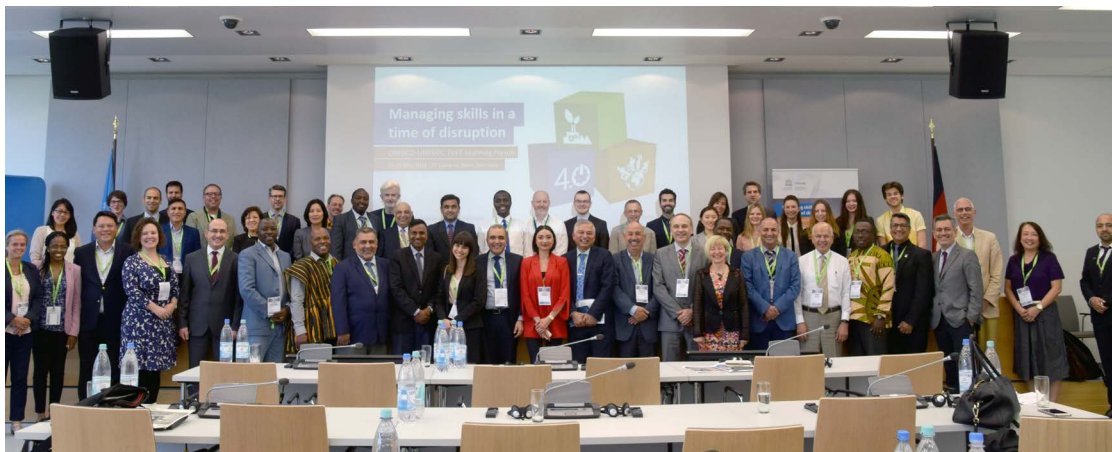
Participantes y organizadores tras la sesión de clausura del Foro.

UNESCO-UNEVOC y sus asociados manifiestan su gratitud a todos los participantes y especialistas que intervinieron en los debates y aportaron valiosas líneas y ejemplos de cooperación en el ámbito de la EFTP.